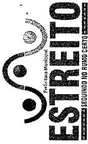
ANEXO II TABELA III-TABELA DE SALARIO PARA O QUADRO DO MAGISTERIO JORNADA DE TRABALHO DE 20 HORAS SEMANAIS